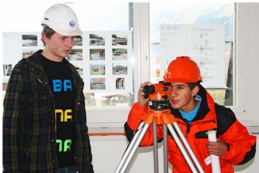
Geräte wie das Nivellierungsinstrument konnten am Berufswahlanlass ausprobiert werden.